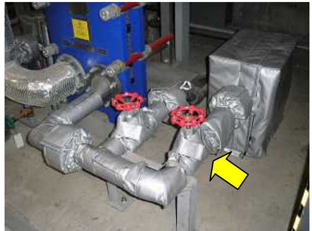
【 施工後 】