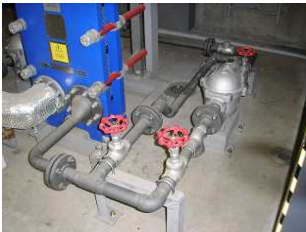
【 施工前 】