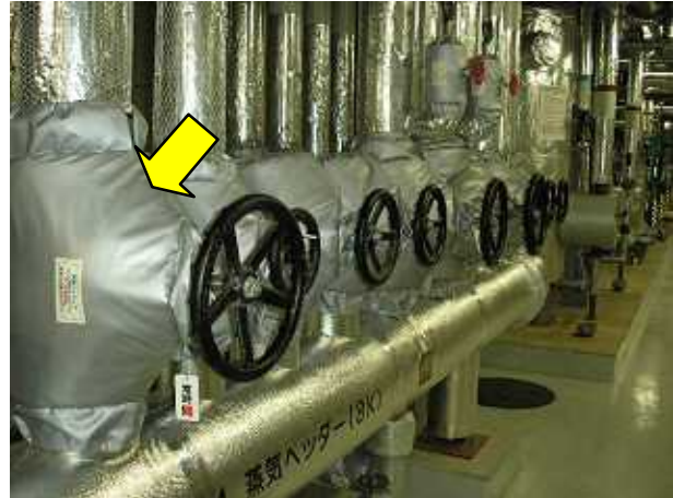
【 施工後 】