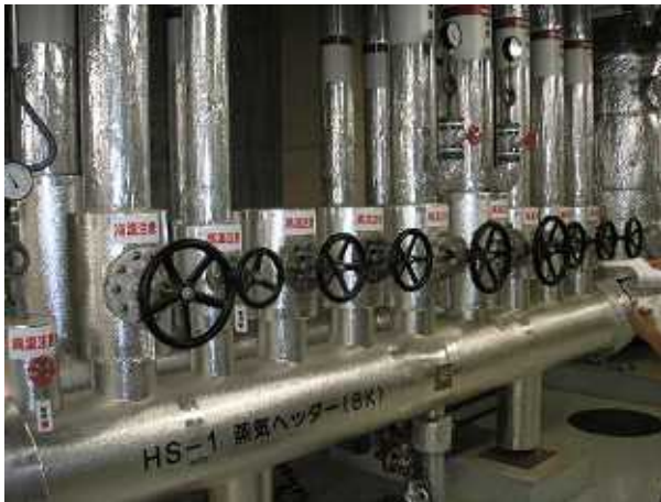
【 施工前 】