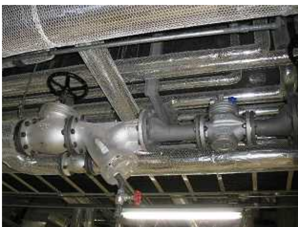
【 施工前 】