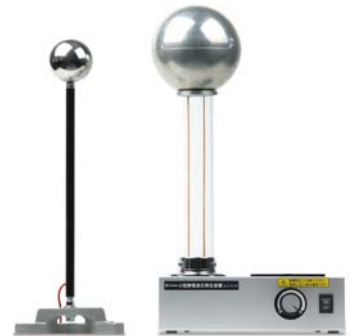
45708 小型静電高圧発生装置 (ミニバンデ)実験セット