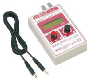
45951 実験用低周波発振器 (マイ・発振器) YDO-10K