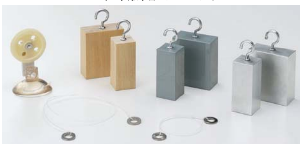
51704 浮力実験用体 BU-5N