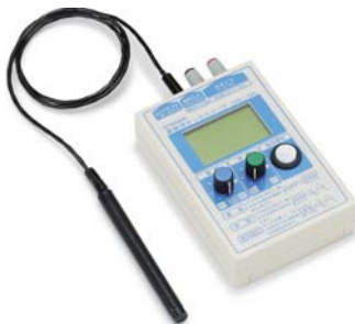
45950 実験用オシロスコープ (マイ・オシロ) YDS-10K