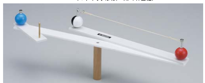
45447 月・金星の動きモデル実験器

☆このリストは右記のURLからダウンロードできます。→ http://www.yagami-inc.co.jp/view/science/news/rikasetsubi