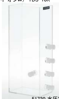
51720 水圧実験学習セット 2セット組