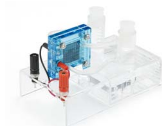
45673 電気分解実験器 (燃料電池兼用型) PBE